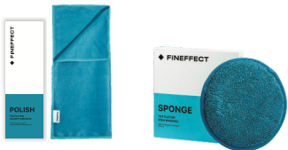
Салфетка Polish Губка Sponge