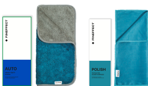
Салфетка Auto Салфетка Polish