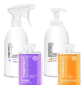
Home Gloss Plus