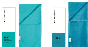
Салфетка Soft Салфетка Polish