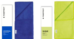
Салфетка Universal Салфетка Shine