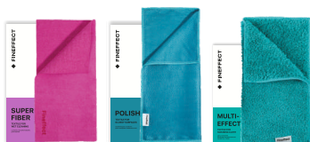
Салфетка Superfiber Салфетка Polish Салфетка Multi-effect