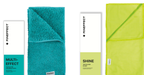
Салфетка Multi-effect Салфетка Shine