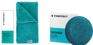
Салфетка Multi-effect Губка Sponge