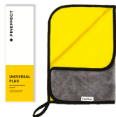
Салфетка Universal Plus