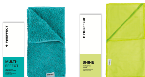
Салфетка Multi-effect Салфетка Shine