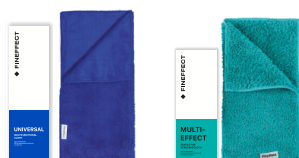
Салфетка Universal Салфетка Multi-effect