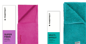
Салфетка Superfiber Салфетка Multi-effect