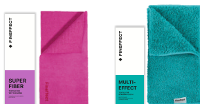
Салфетка Superfiber Салфетка Multi-effect