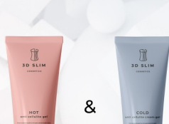
СХЕМА ОДНОВРЕМЕННОГО ПРИМЕНЕНИЯ ДУЭТОМ